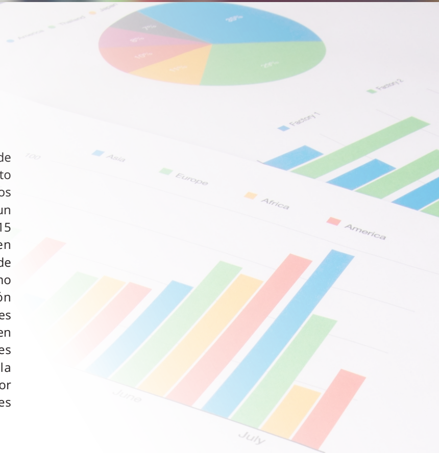
FIGURA 1. Consumo de Cigarrillos: Cambio en el total de ventas ante un aumento de 15 puntos porcentuales en el impuesto al tabaco

Los resultados del modelo de equilibrio general de CEDLAS (2021) muestran que un aumento en el impuesto al tabaco resulta en un aumento en el precio de los cigarrillos, una caída del consumo de cigarrillos, y un aumento de los recursos tributarios. Una subida de 15 puntos porcentuales en el impuesto al tabaco en Argentina lleva a un aumento aproximado en el precio de los cigarrillos de 39% y una caída aproximada del consumo de cigarrillos de 12.7% (Figura 1). Esta reducción representa aproximadamente 218 millones de paquetes de cigarrillos en el corto plazo. Para poner en contexto, en Argentina se consumen 150 millones de paquetes mensuales. A pesar de la caída del consumo, la recaudación por el impuesto al tabaco aumenta alrededor de 60% y la recaudación total aumenta en valores cercanos a 0.7% (Figura 2)